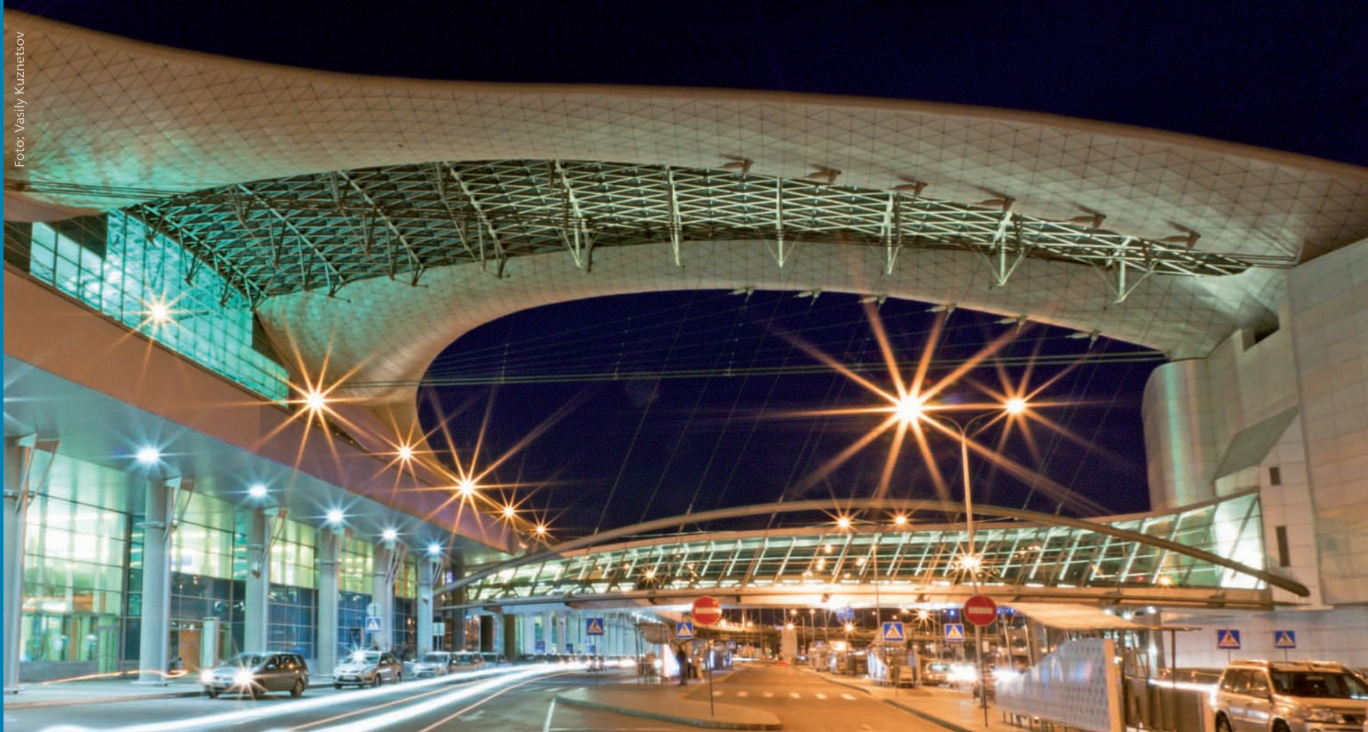
Übedachung Flughafen Sheremetyevo, Moskau