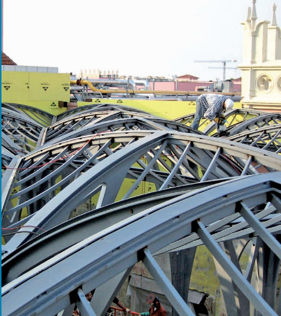
Foliendach Boca Raton Resort Club, Florida