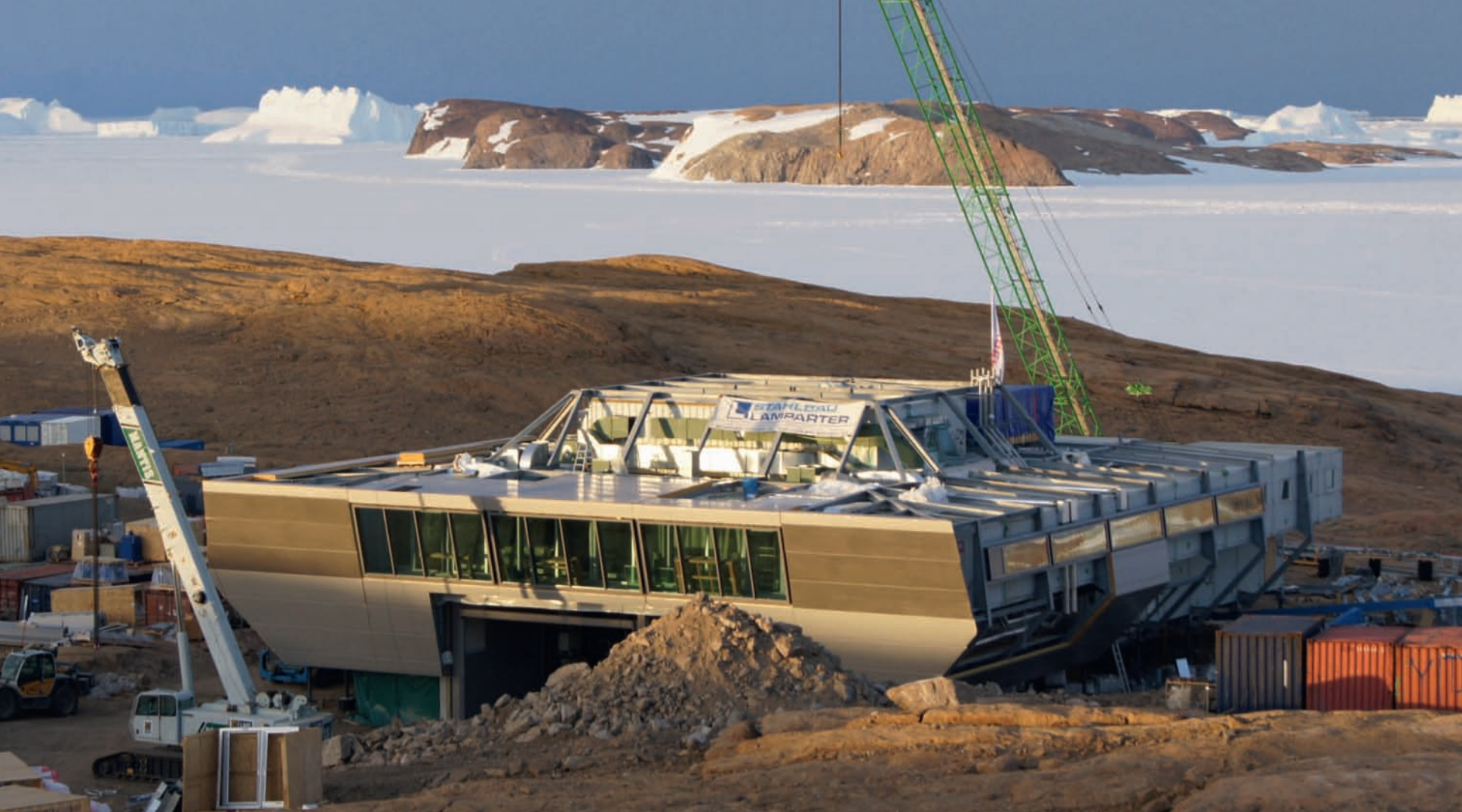
Forschungsstation Bharati, Antarktis