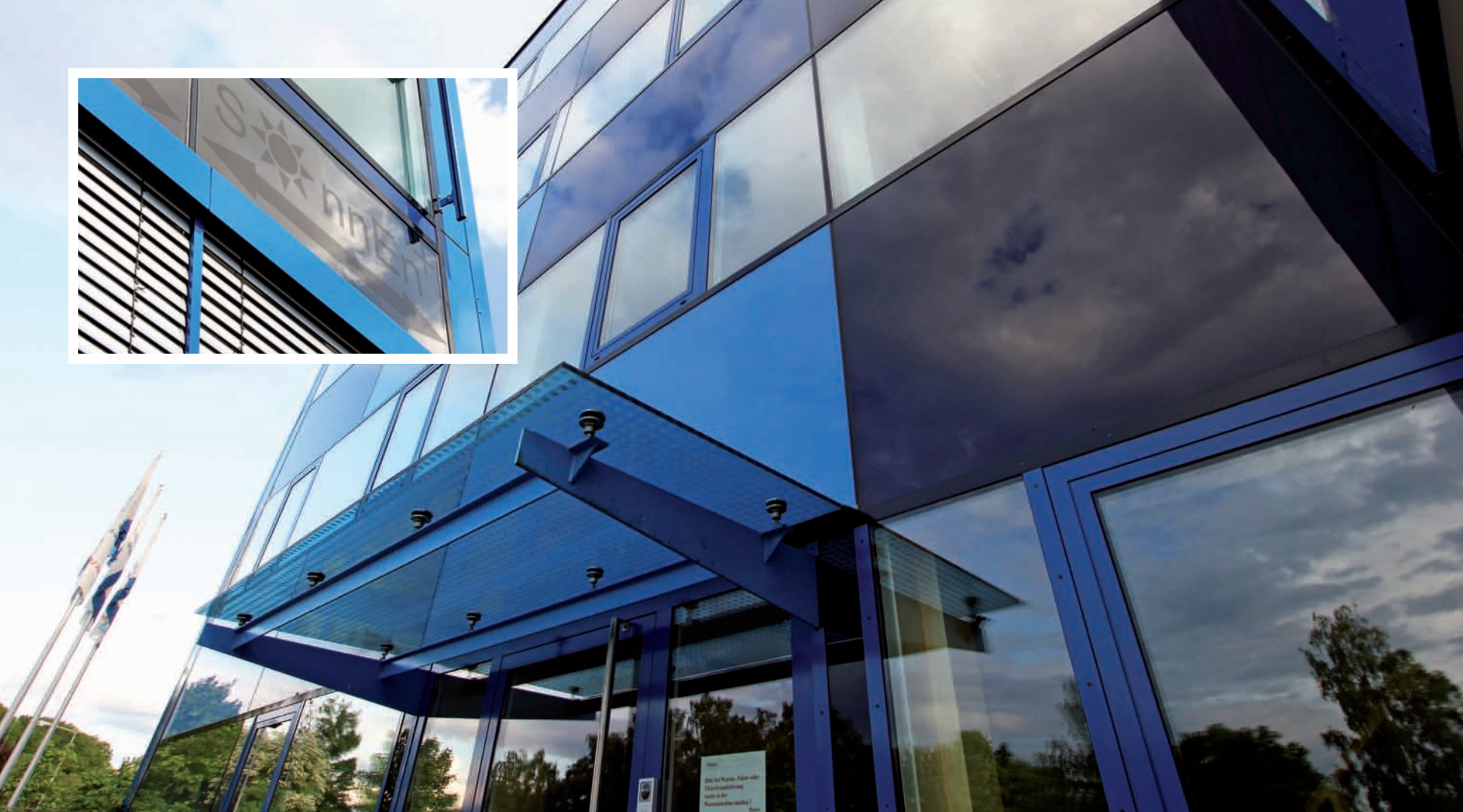
STAHLBAU LAMPARTER Bürogebäude, Kaufungen